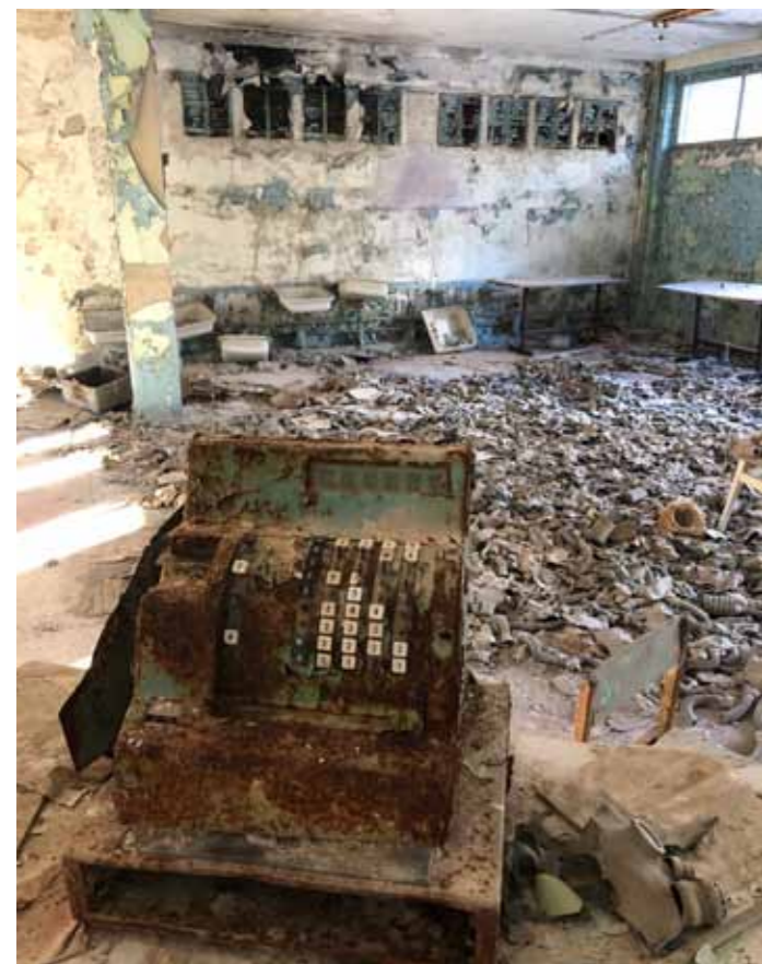
Ukrajinské město Pripjat vzdálené tři kilometry od Černobylské jaderné elektrárny. Tady před havárií v roce 1986 býval obchod...