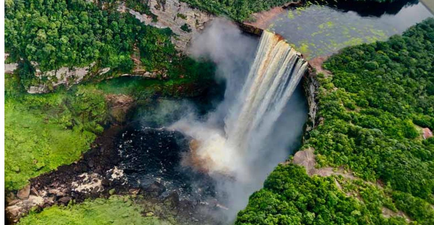
▲ Kaiovy vodopády nebo také Vodopády mrtvého muže se nacházejí v Guyaně. Dosahují výšky 226 metrů a patří k nejpůsobivějším vodopádům světa. Masová turistika se jim naštěstí zatím vyhýbá.

Velmi rychle si ji oblíbili. Má sedmdesátiletá babička si s ní skvěle rozuměla, domluvily se i bez znalosti cizí řeči. Stačil jim vřelý úsměv. Ze začátku snoubenka mluvila anglicky, protože Zimbabwe bylo historicky pod britskou nadvládou. A díky tomu tam měli rád. Mně to tam ostatně Británii dost připomínalo... Já jsem do Prostějova dojížděl na víkendy, protože jsem přes týden pracoval v Praze. Přes kolegyni z práce jsme pak