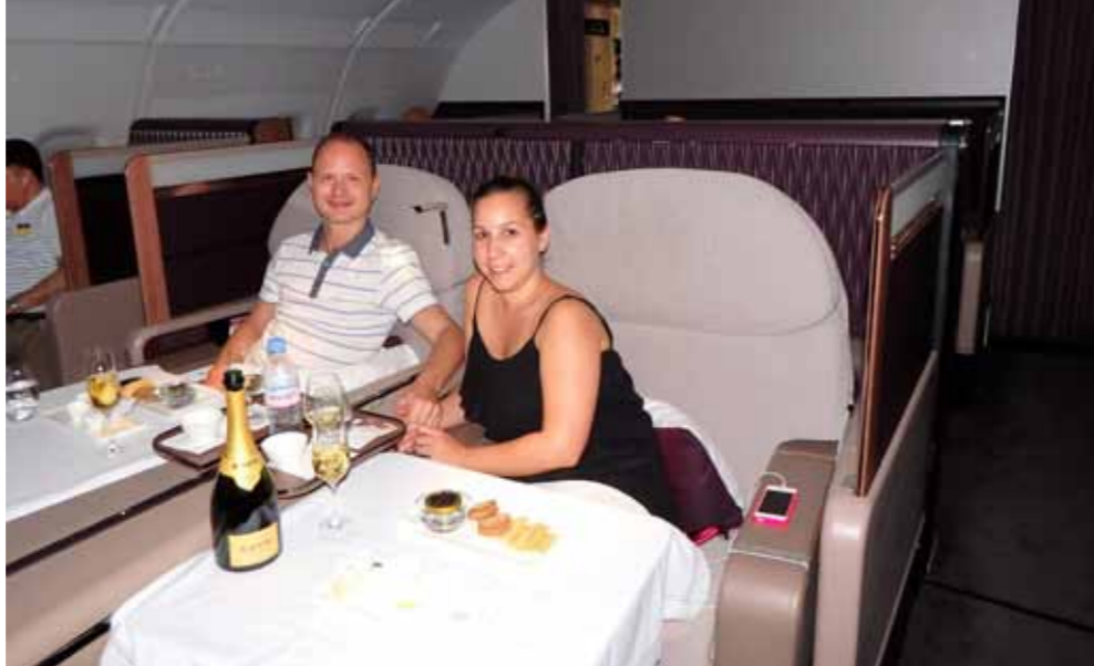
▲ Se současnou přítelkyní v první třídě letecké společnosti Qatar Airways, konkrétně let z katarského Dauhá do thajského Bangkoku.

Bohužel kvůli diktatuře Mugabeho se to změnilo k horšímu. Po roce 2000 vyhnali bílé farmáře, díky této minoritě, jež velmi schopně podnikala, to tam všechno fungovalo. Poté vznikl obrovský chaos. V roce 2008 jsme tam se ženou jeli, to bylo akorát před volbami, zemi ochromila hyperinflace, po Maďarsku ve 40. letech snad největší v historii lidstva. Do obchodu jsme jezdili s batohy peněz. Za dva hamburgery s hranolkou jsme zaplatili asi 11 miliard. Bankovky vystřídal agrošeky, pak byly zase bankovky. Oni neustále tiskli nové peníze někde v Německu. Mám doma dokonce bankovku o hodnotě sto trilionů (podle české soustavy sto bilionů, tedy obsahující 14 nul, pozn. red.). Na začátku pobytu to bylo na naše asi dva tisíce korun, ale každý den to šlo dolů, ke konci zhruba na deset korun. Pak po té bankovce byl velký hlad mezi sběrateli, takže jsem ji přes eBay prodával za 25 dolarů a peníze se posílaly početné ro-